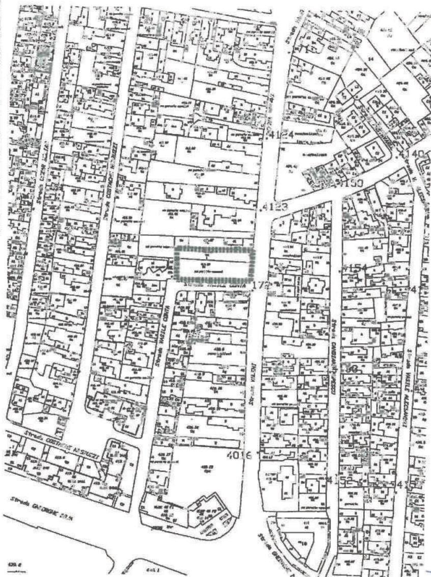
PLAN DE INCADRARE sc 1:2000

S.D.E. MONTAJI NORD S.A. S.I.E. PLOESTI CENTRUL DE PROIECTARE SI VIZAT SI REINSCALABARE SC/COMPL.